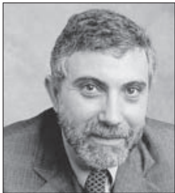
Paul Krugman © 2012 New York Times News Service

The big bad event of last week was, of course, the Supreme Court hearing on health reform. In the course of that hearing it became clear that several of the justices, and possibly a majority, are political creatures pure and simple, willing to embrace any argument, no matter how absurd, that serves the interests of Team Republican.